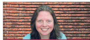
Marina van der Ploeg Digitaal Collectiebeheer